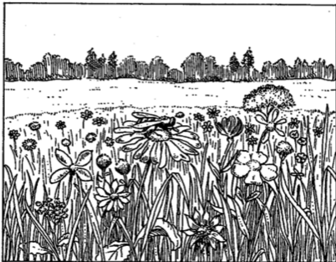
Pl. 5a. L'entourage de l'abeille